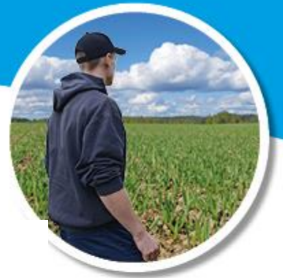
Maatilan omaisuusosien käyvät arvot, arvio

- Talouden ABC -laskentatyökalu, esimerkki grafiikasta: